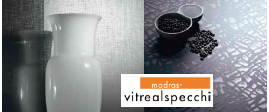
Designgläser Madras® Lino (links) und Miami (rechts) rückseitig schwarz lackiert.