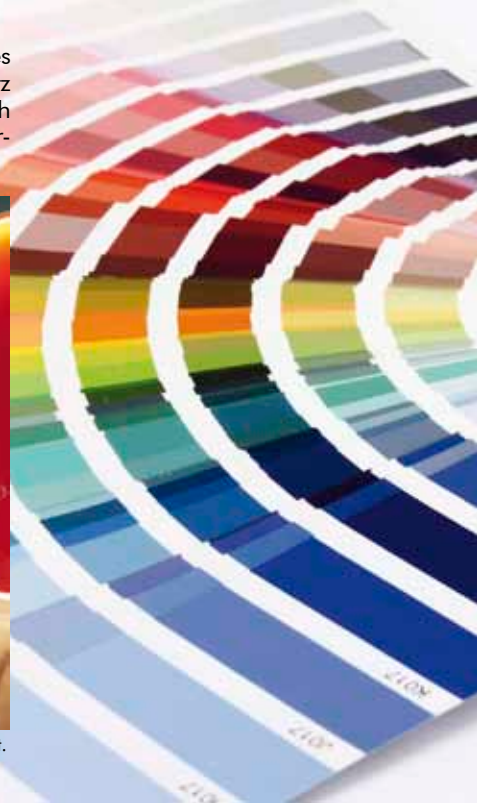
In jeder Küche setzen farbige Rückwände aus Glas besondere Akzente. Vielseitig und individuell in allen RAL Farben lackiert.