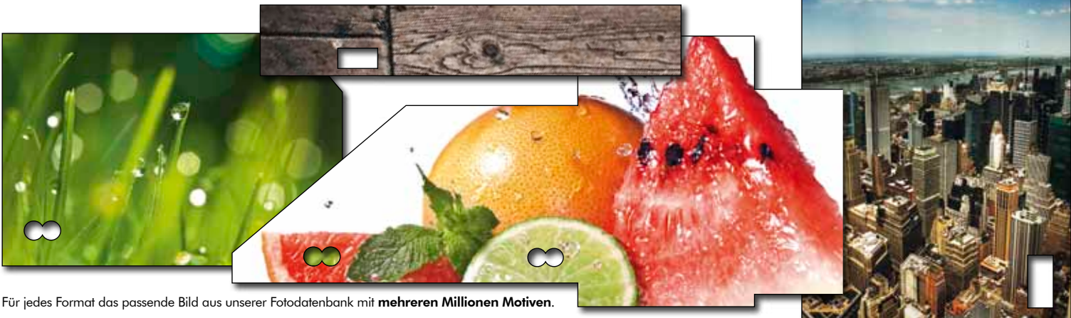
Für jedes Format das passende Bild aus unserer Fotodatenbank mit mehreren Millionen Motiven .