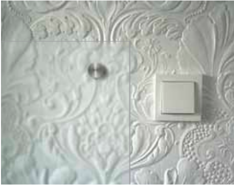
Weißglas Satinato als Schutz Ihrer wertvollen Tapete.

verwischt und Designgläser schaffen Strukturen. Fast alle Gläser lassen sich lackieren oder bedrucken, so addieren sich die Effekte.