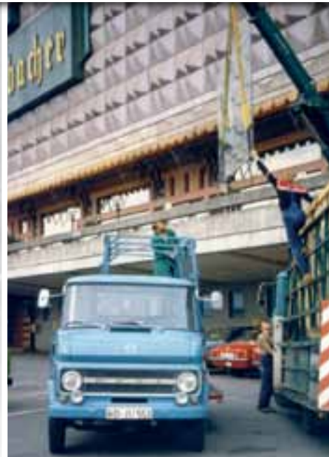
Reparaturarbeiten Große Fensterflächen bei der Königsbacher Brauerei.