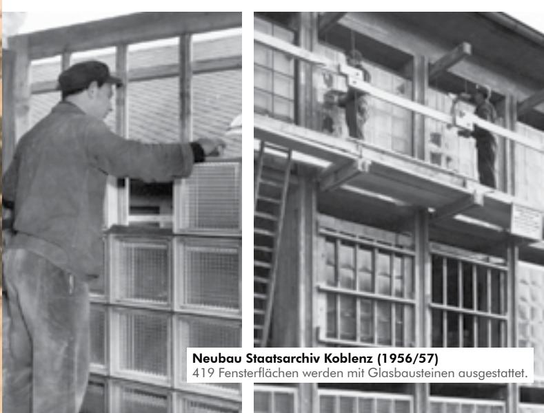
Neubau Staatsarchiv Koblenz (1956/57) 419 Fensterflächen werden mit Glasbausteinen ausgestattet.