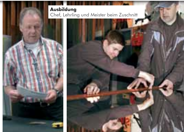
Ausbildung Chef, Lehrling und Meister beim Zuschnitt