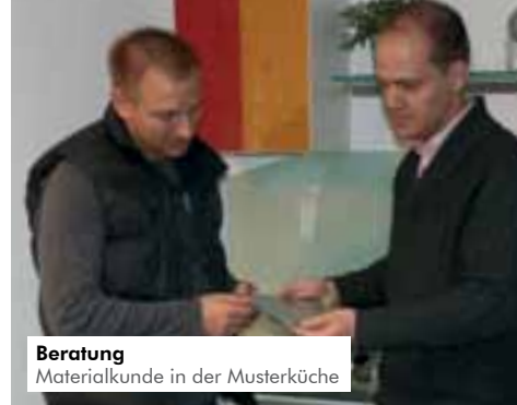
Beratung Materialkunde in der Musterküche