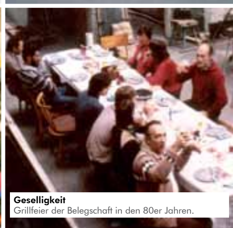
Geselligkeit Grillfeier der Belegschaft in den 80er Jahren.

Glas-Zitto GmbH Lieferanschrift und Parkplätze: Am Alten Hospital 13 56068 Koblenz Ausstellung und Verkauf: Eltzerhofstraße 7 56068 Koblenz Telefon: 0261 - 14044 Telefax: 0261 - 36542 Internet: www.glas-zitto.de Email: kontakt@glas-zitto.de