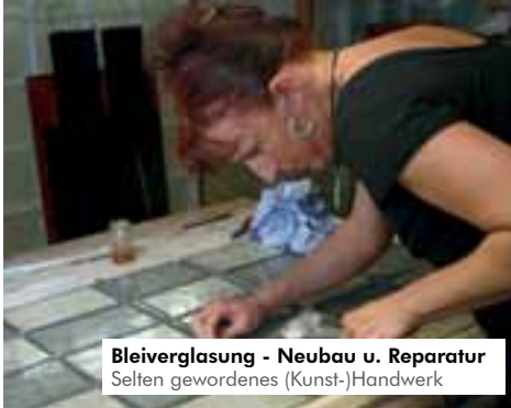
Bleiverglasung - Neubau u. Reparatur Selten gewordenes (Kunst-)Handwerk