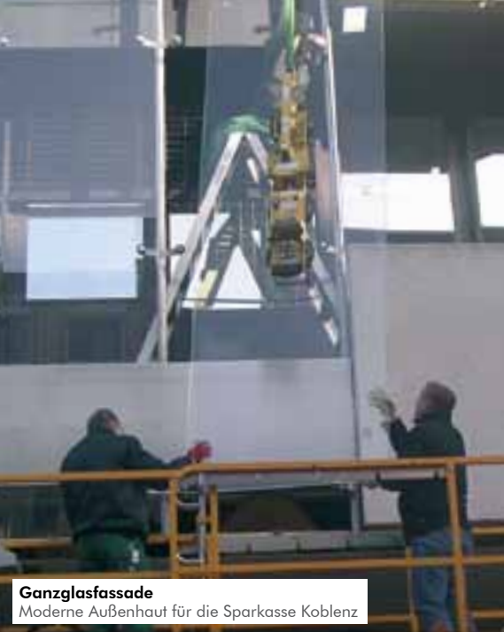
Ganzglasfassade Moderne Außenhaut für die Sparkasse Koblenz