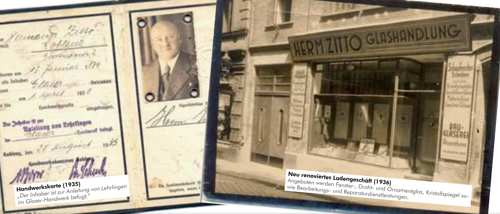
Handwerkskarte (1935) „Der Inhaber ist zur Anleitung von Lehrlingen im Glaser-Handwerk befugt.“