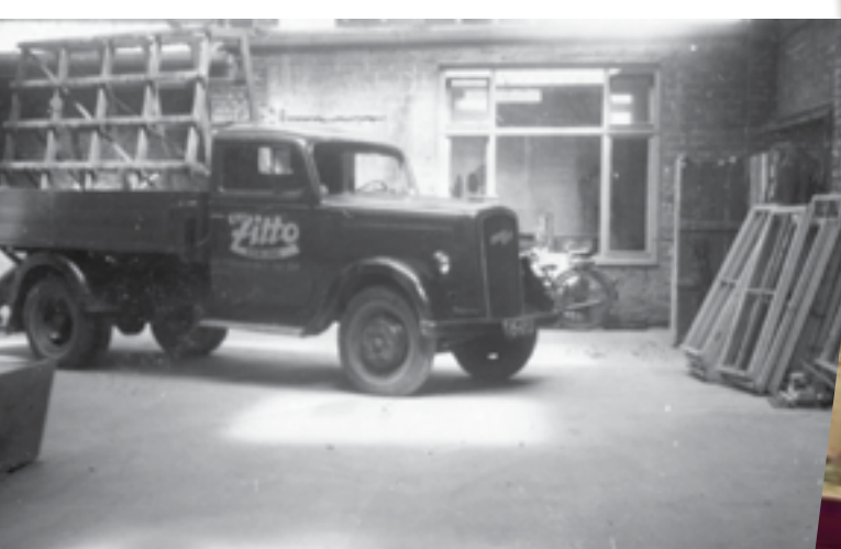
Ladehalle und Lieferwagen Marke „Opel Blitz“ (1950er) Bis heute parken an dieser Stelle Fahrzeuge der Firma.