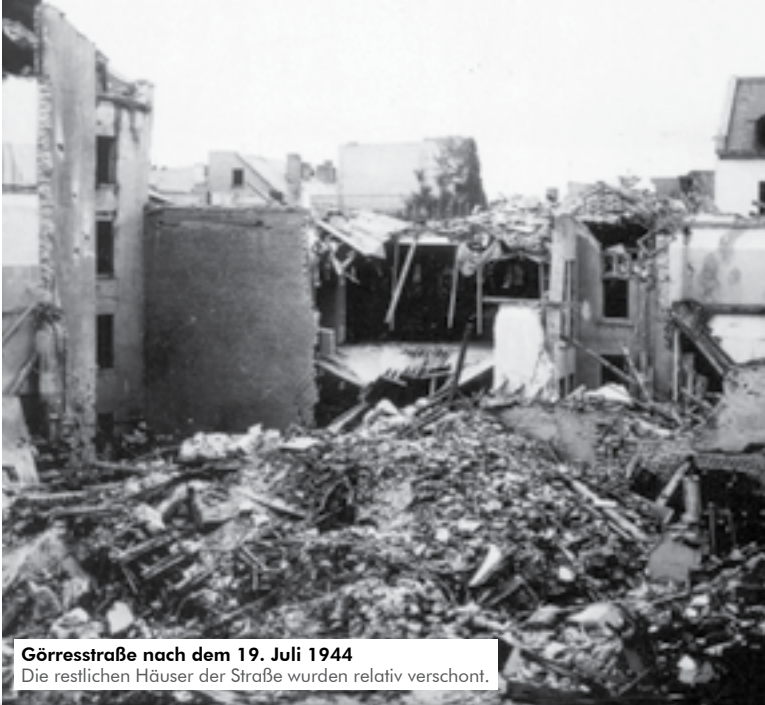
Görresstraße nach dem 19. Juli 1944 Die restlichen Häuser der Straße wurden relativ verschont.