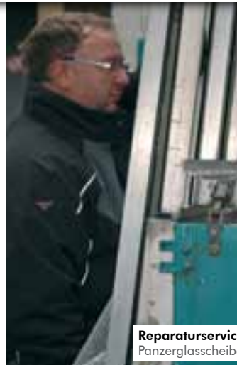
Reparaturservice Panzerglasscheibe im Entenpfuhl in der Altstadt