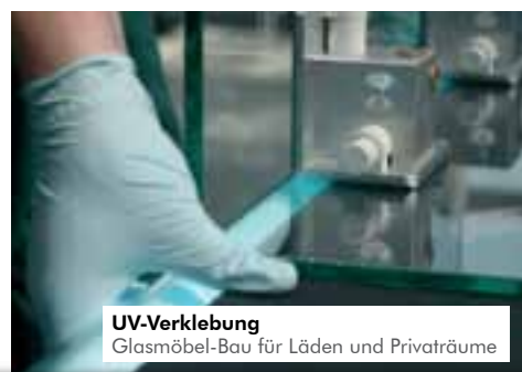
UV-Verklebung Glasmöbel-Bau für Läden und Privaträume