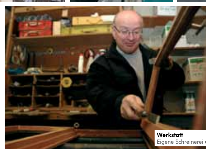
Werkstatt Eigene Schreinerei und Schleiferei

oder nach Terminabsprache auch außerhalb der Öffnungszeiten!