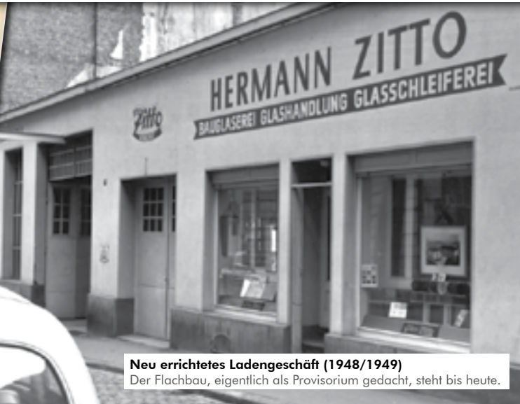
Neu errichtetes Ladengeschäft (1948/1949) Der Flachbau, eigentlich als Provisorium gedacht, steht bis heute.